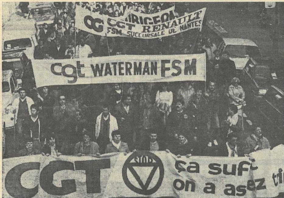
Dans les rues de Nantes le 4 décembre contre la flexibilité

larges extraits de l'intervention de Serge Doussin, secrétaire de l'UD C.G.T. lors du meeting du 4 décembre.