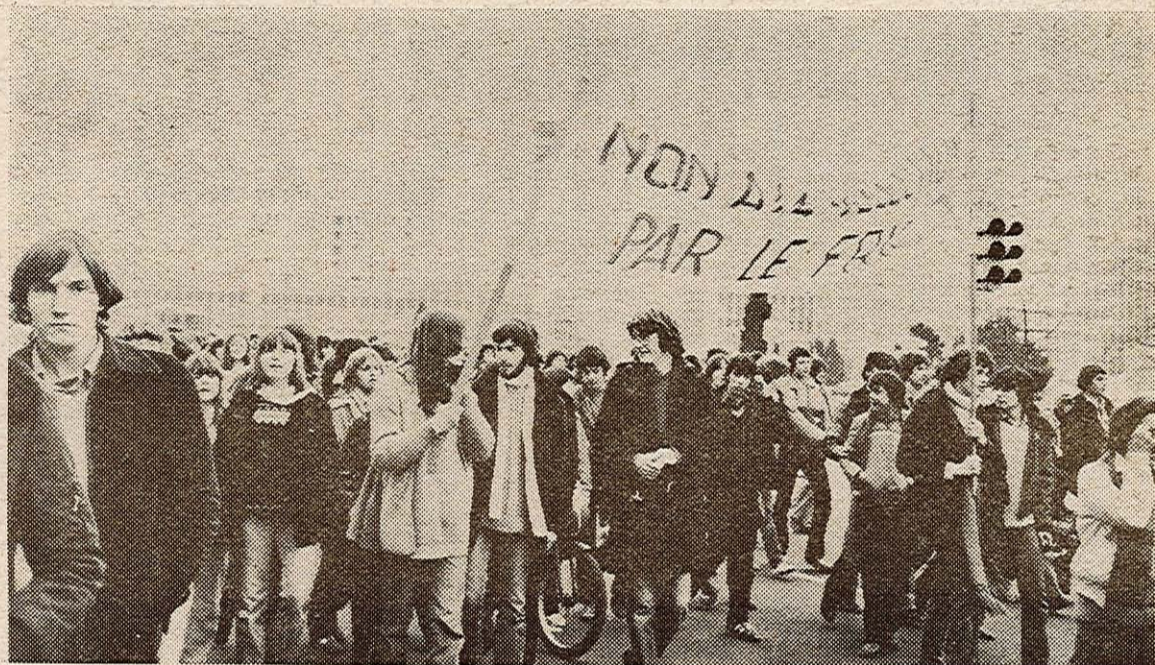
Mercredi dernier, les étudiants ont une nouvelle fois manifesté contre les décrets répressifs et racistes du pouvoir.