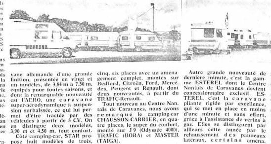
Autre grande nouveauté de dernière minute, c'est la gamme ESTERIL dont le Centre Nantais de Caravanes devient concessionnaire exclusif.

Du samedi 10 au mardi 20 octobre, se tenait le Salon du Centre Nantais de Caravanes, route de Vannes, à Nantes Saint-Herblain. Toutes les nouveautés 83 et caravanes camping-car, pilantes et habitation de plusieurs grandes marques.