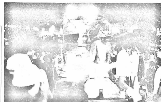
Des dizaines de milliers de Nantaises et de Nantais sont venus, enthousiastes, assister au lancement de ce bateau.