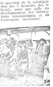
Mardi dernier, les femmes et enfants des licenciés (à l'un vit entourés de travailleurs et responsables syndicaux de la SNIAS) ont pénétré dans l'usine afin de remettre une lettre destinée au directeur.

Il était prévu qu'il participe dans un atelier de l'usine à une importante assemblée des syndiqués et sympathisants CGT. Au cours de cette réunion, il devait aborder la question de la réintégration des 7 licenciés, des bérés, ainsi que celle du développement des fabrications aéronautiques et de l'embauche nécessaire.