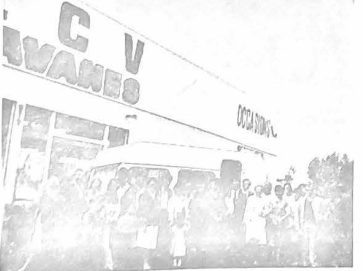
Photo de famille des gagnants devant la caravane du vainqueur...