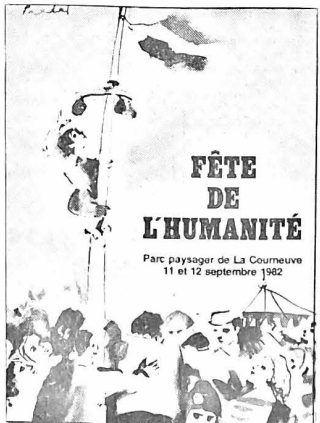
Amis lecteurs des Nouvelles, sachez des autres, vous aussi inscrivez-vous pour la fête de l'Humanité et venez nous rendre visite au stand de la Fédération de Loire-Atlantique rue de la Vendée (espace Ouest).

L'importance politique de la fête de l'Humanité que les collèges du département développent dans la semaine qui reste une grande activité pour nos militants de nombreuses inscriptions pour aller à la fête de l'Humanité.