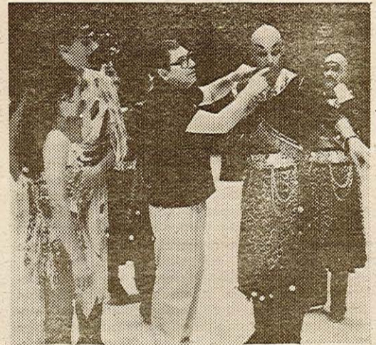
Robert HOSSEIN, lors d'une répétition du spectacle « La Symphonie des Sables ».