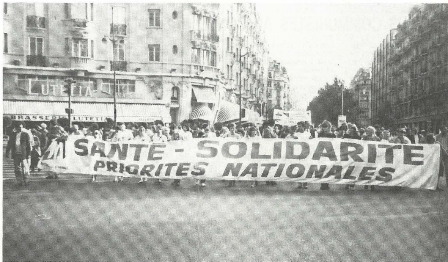
L'ACTION CONTRE LA CONTRIBUTION SOCIALE GÉNÉRALISÉE SE RENFORCE ET S'ÉLARGIT