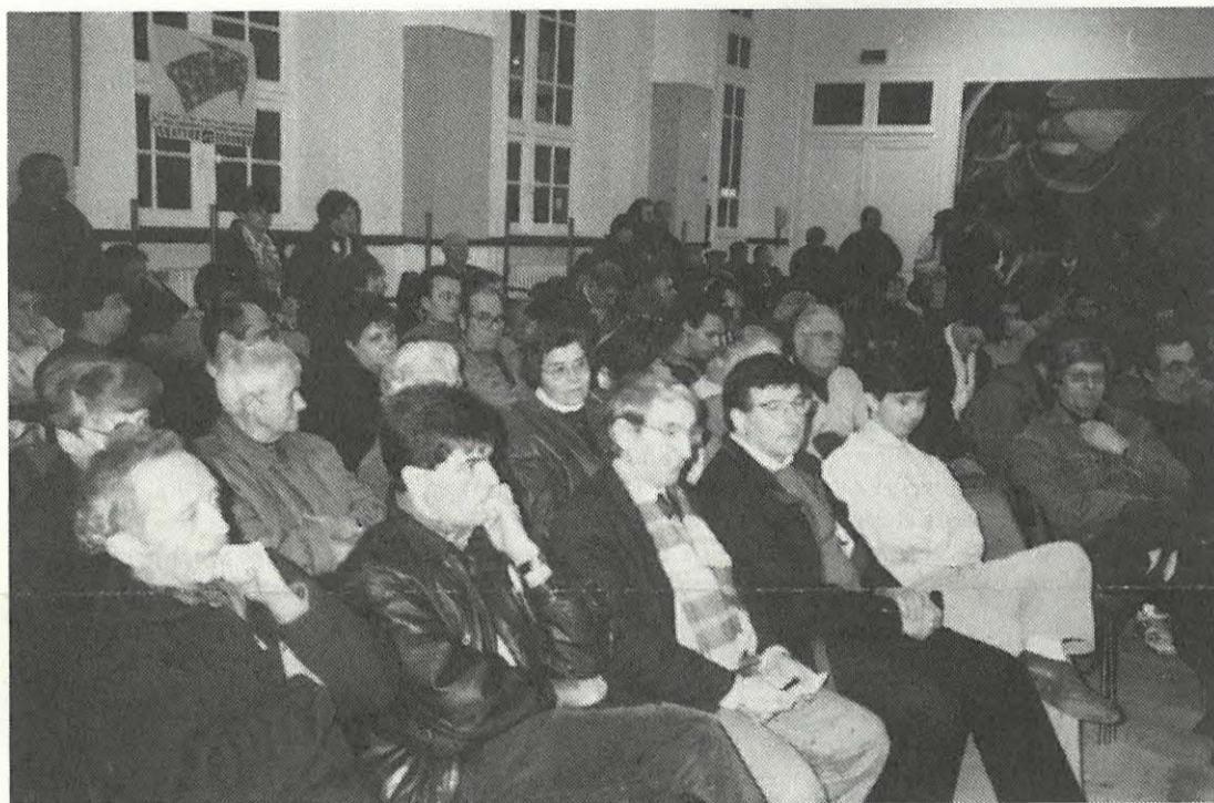
Une partie de l'assistance au débat de Nantes où participait Jean-Claude GAYSSOT, secrétaire du Comité central du PCF. 250 personnes étaient présentes.

La campagne des débats engagés par le PCF s'achève. Elle est riche d'enseignements, elle répond à notre attente. Nous avons beaucoup appris, nous espérons qu'il en est de même pour tous les participants dont un cinquième à un quart n'étaient pas membres de notre parti.