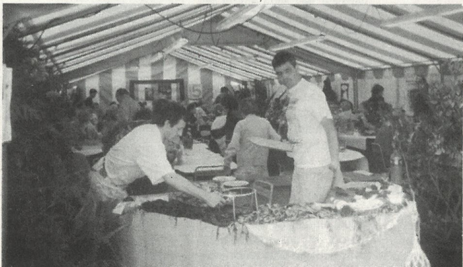
Devant le public, les écailleurs seront très remarqués.