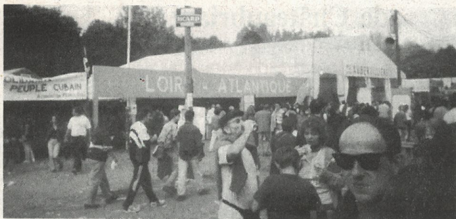
Le stand de la Fédération de Loire-Atlantique.

C'est tout cela la fête de l'Humanité, une extraordinaire rencontre dans un climat de dialogue, d'échange, en toute liberté de parole, de confrontation et dans une forte volonté populaire pour agir afin de vraiment changer les choses et construire une véritable alternative politique dans notre pays.