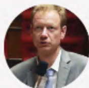
MARDI 28/04 PIERRE DHARREVILLE Député PCF