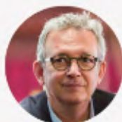
MERCREDI 29/04 PIERRE LAURENT Sénateur PCF