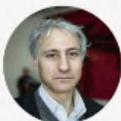
LUNDI 27/04 FREDERIC BOCCARA Economiste