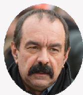
JEUDI 30/04 PHILIPPE MARTINEZ Secrétaire Général de la CGT